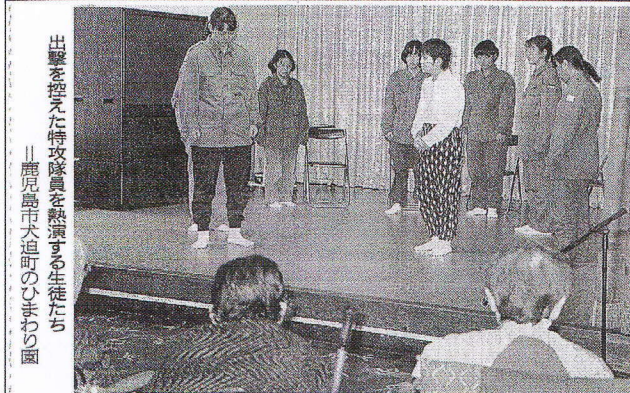
出撃を控えた特攻隊員を熱演する生徒たち 鹿児島市大迫町のひまわり園