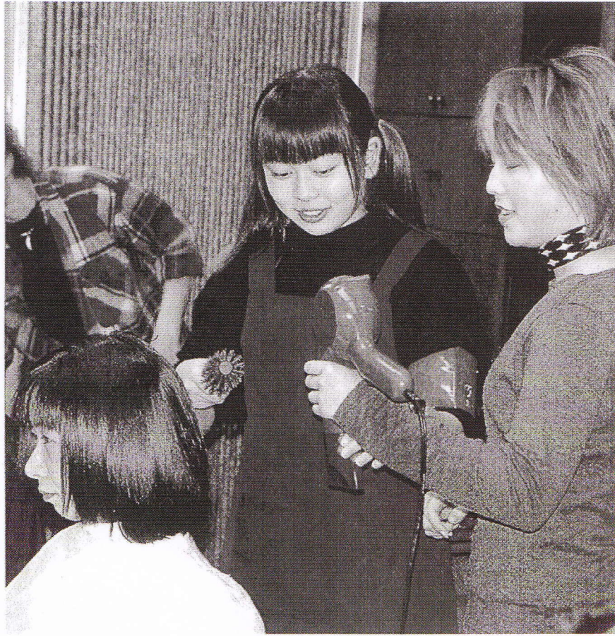
ヘアスタイル調整に挑戦する鹿児島西高の生徒 11月16日、鹿児島市中町