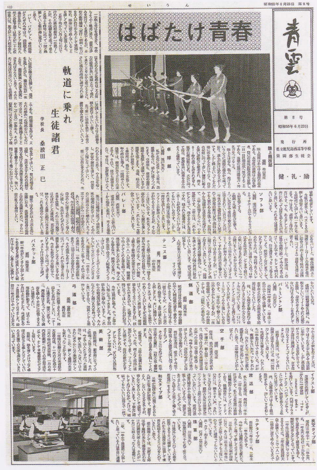
昭和55年6月発行「青雲」より